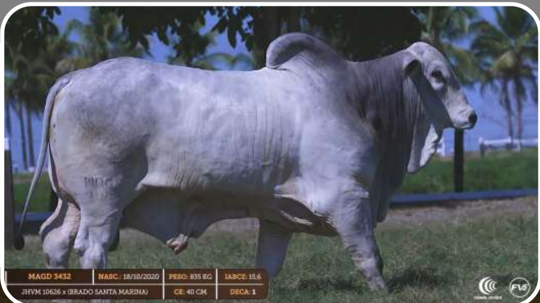
MAGD 3432 NASC.: 18/10/2020 PESO: 835 KG IABCZ: 15,6 JHVM 10626 x (BRADO SANTA MARINA) CE: 40 CM DECA: 1